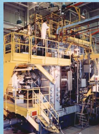
Camera a bolle di Brookhaven