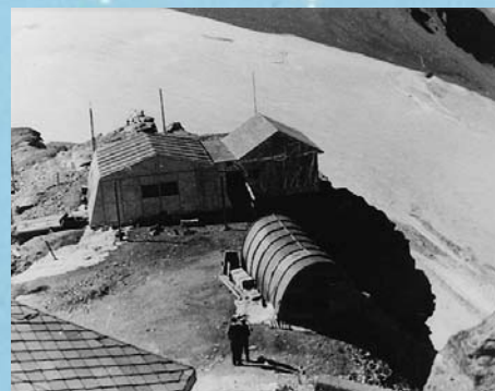
Lab. Testa Grigia